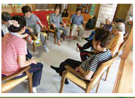
個別機能訓練！1・2・3！