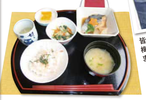
お好みやご要望に合わせたお食事をご提供。