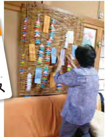
季節毎の行事を楽しみながら、 心と体の健康づくりに 取り組んでいます。