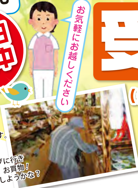
ドライブに行きました。お買物！ どれにしようかな？