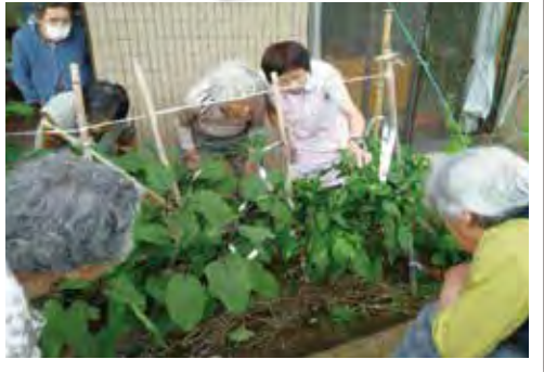
晴れた日は菜園で野菜作りも楽しめます。