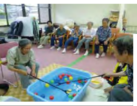
運動を兼ねたゲームで笑顔もこぼれて。