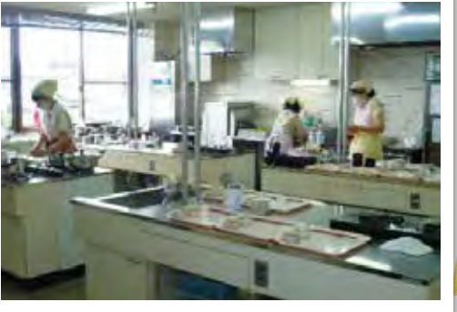
こころを込めた手作りの昼食。