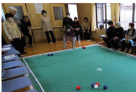
旭ヶ丘ふれあいサロン (西岐波)