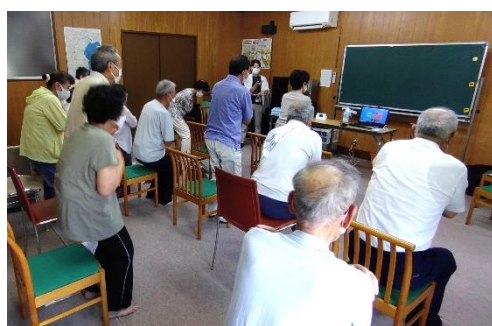
東萩原ふれあいサロン (西岐波)