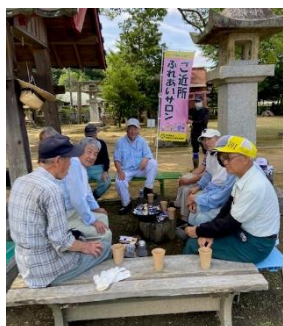
元気サロニーの会 (船木)