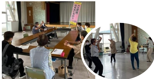
お楽しみサロン楠民舞会 (船木)

介護予防や生きがいづくり、そして、地域づくりに効果大の“ご近所ふれあいサロン”が見初 40 区ふれあいサロン(見初)等 6 か所でスタートしました。